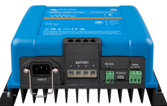
Phoenix Smart 12/50(3)