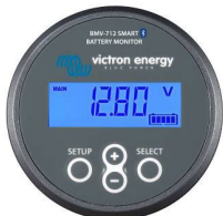
Bluetooth-Messung: BMV-712 Smart Batteriemonitor